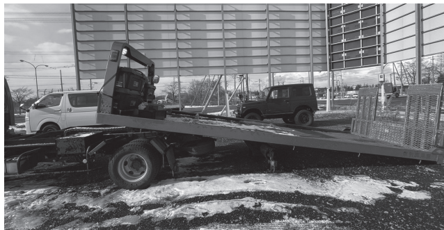
動けなくなった車をお客様の指定場所まで運びます

みなさんがJAFを呼んだ際、駆けつけてくる隊員のおよそ6割はJAF本部の間人ではありません。JAFと地域で契約している指定工場の隊員が駆けつけています。本部の隊員だけでは、全国各地で起こるロードサービスに対して対応することが不可能なので、それぞれの地域の業者などと協力して各地で起こるトラブルにロードサービスという形で対応しなければならないからです。だからと言って、『JAF本部の隊員』と『JAF本部じゃない隊員』の違いはご依頼者であるお客様には全く関係のないことです。JAFの根本の考え方として、本部の間人であるか否かに関わらず、お客様にはJAFの高水準のサービスを受けてほしいという考えがあります。その考えに基づき、協力する業者のことは‘下請け’とか‘代理店’という呼び方はせずに、本部もその他の業者も皆横一列でお客様に対応していきたいという思いから、指定工場という呼び方をしています。