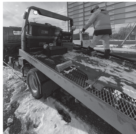
太いワイヤーで車を引っ張り、荷台に載せます