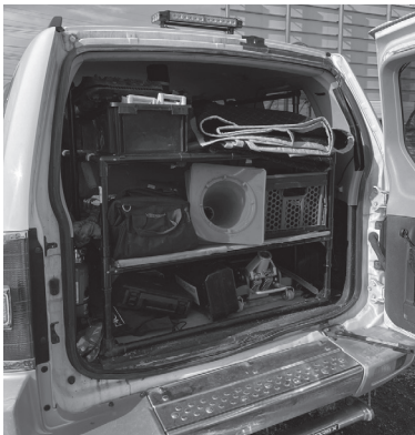
荷台にはロードサービスに必要なものがギッシリ積まれています