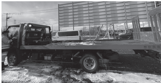
持っている車や機械で対応できない場合は、他の指定工場に協力をお願いすることもあります

本部も本部以外の隊員も力量や知識がバラバラにならず、一定水準を満たすように日頃から研修や教育、試験を行っており、その結果が現在のJAFの高水準でばらつきのないサービスに繋がっています。