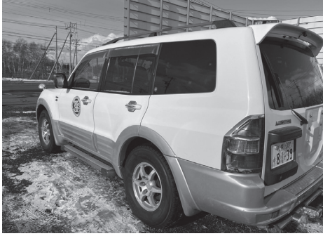
このパジェロで動けなくなった車をけん引します

現在、JAFは約14.9秒に1件の割合（2020年度）で救援活動をしています。当然ながら車に関するトラブルはいつでもどこで起こるかわかりません。ドライバーやライダーの安心安全のために、全国津々浦々にJAFの隊員が駆け付けることができるということが他社のサービスを凌駕する最大の強みであると言えます。