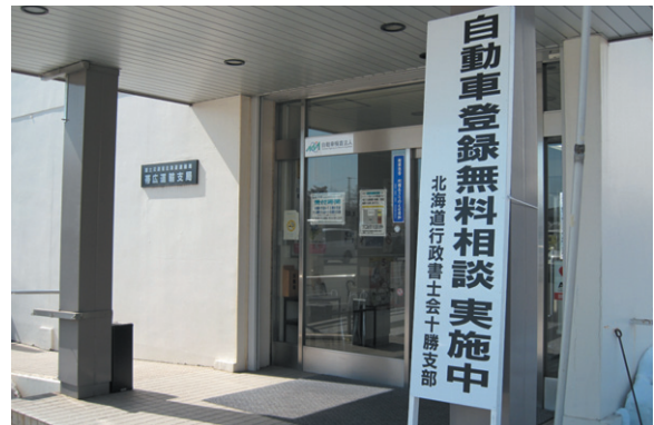
支局玄関の案内板