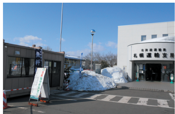
札幌運輸支局前のプレハブ(相談ブース)