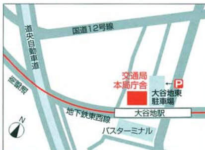
▶ 特約駐車場: 大谷地東駐車場

(南郷通をはさんでバスターミナル向かい) ・「大谷地ターミナル」(JRバス)下車 ・「大谷地駅(バスターミナル)」(中央バス)下車