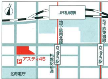
▶ 特約駐車場: アスティ45地下駐車場

● 北部市税事務所周辺は自転車等の放置禁止区域となっていますのでご注意ください。