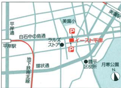
▶ 特約駐車場: タイムズイースト平岸駐車場