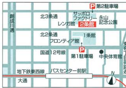
▶ サッポロファクトリー第1~第4駐車場は1時間無料です。 (第2駐車場のご利用は午前10時からとなります。)

・「サッポロファクトリー」(中央バス・JRバス)下車 ・「サッポロファクトリー前」(中央バス)下車