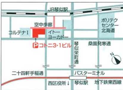
▶ 特約駐車場: コトニ3・1ビル駐車場